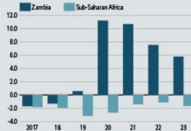
Current-account balance (% of GDP)