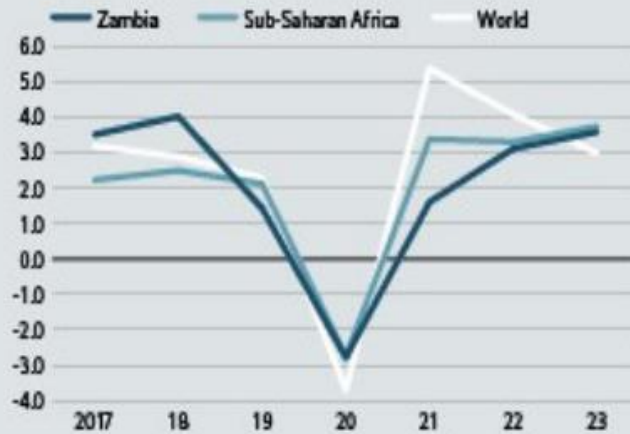
Real GDP growth (% change)