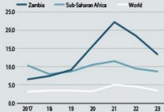
Consumer price inflation (av; %)