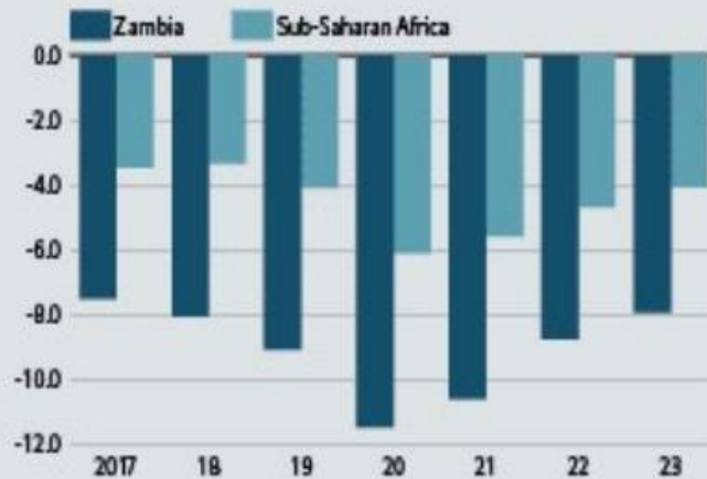
Budget balance (% of GDP)